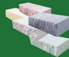
SILIKAT ŁUPANY POŁÓWKA